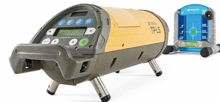
Niwelator rurowy Topcon TP-L5G