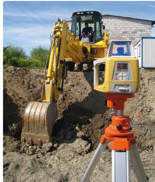
Kontrola głębokości wykopu za pomocą lasera i czujnika zamocowanego na ramieniu koparko-ladowarki.