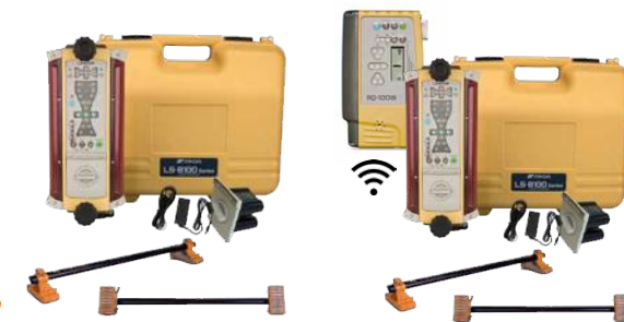
Topcon LS-B110 Pro